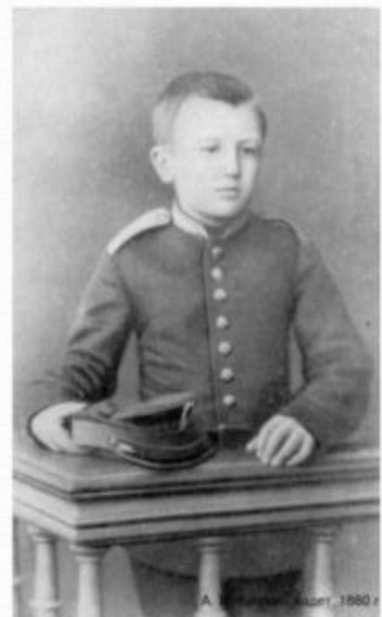
Куприн в форме сиротского училища