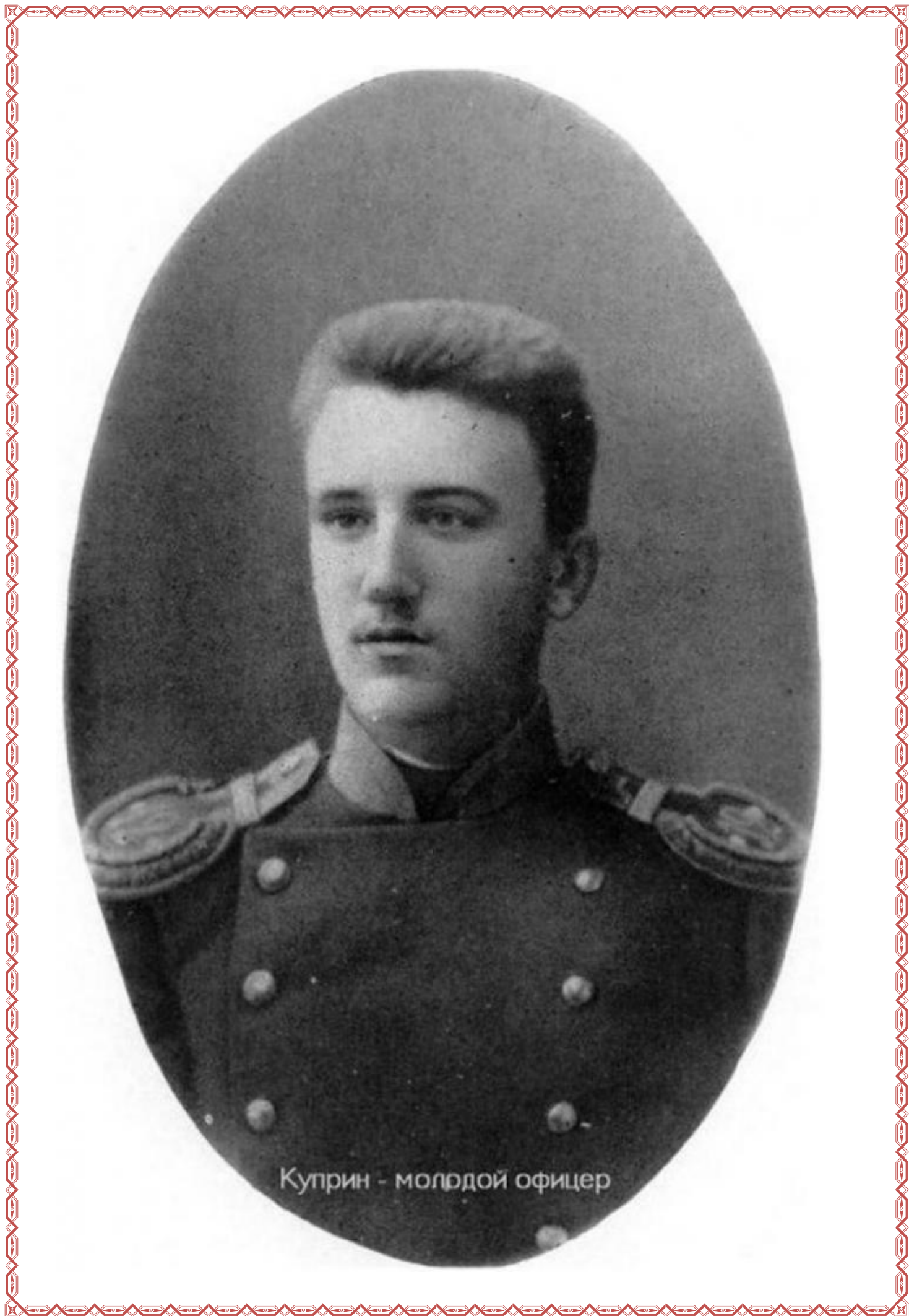
Куприн - молодой офицер