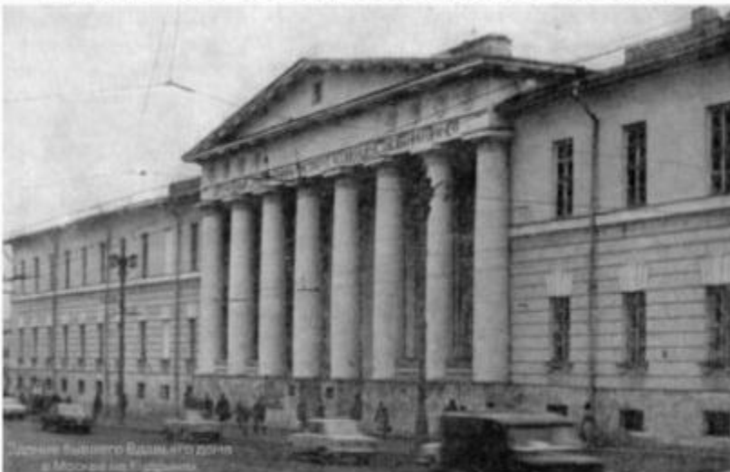
Здание бывшего Вдовьего дома в Москве

Казенная обстановка, злобные старые девы-воспитательницы, наконец, сверстники, которые «были с самого первоначалия исковерканы», — все это причиняло мальчику страдания. Он совершает побег и, проплутав двое суток по Москве, возвращается с повинной в пансион (рассказ 1917 г. «Храбрые беглецы»). — Однако испытания, ждавшие Куприна, только начинались. В десять лет Куприн поступил в военную гимназию (Московский кадетский корпус), а затем в Александровское военное училище. В декабре 1889 года, еще юнкером, Александр Куприн впервые напечатал свой рассказ «Последний дебют» в журнале «Русский сатирический листок». За это он получил первый гонорар – десять рублей и наказание – двое суток карцера (юнкерам военного училища нельзя было ничего публиковать без разрешения начальства).